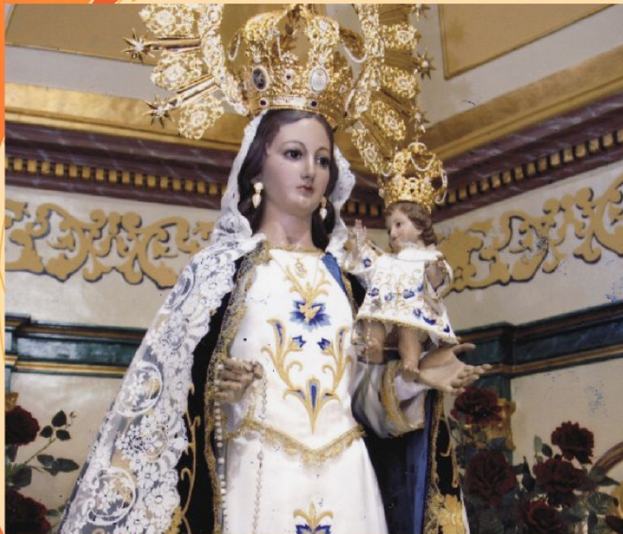
Ntra. Sra. del Rosario - Patrona de Puerto Lumbreras